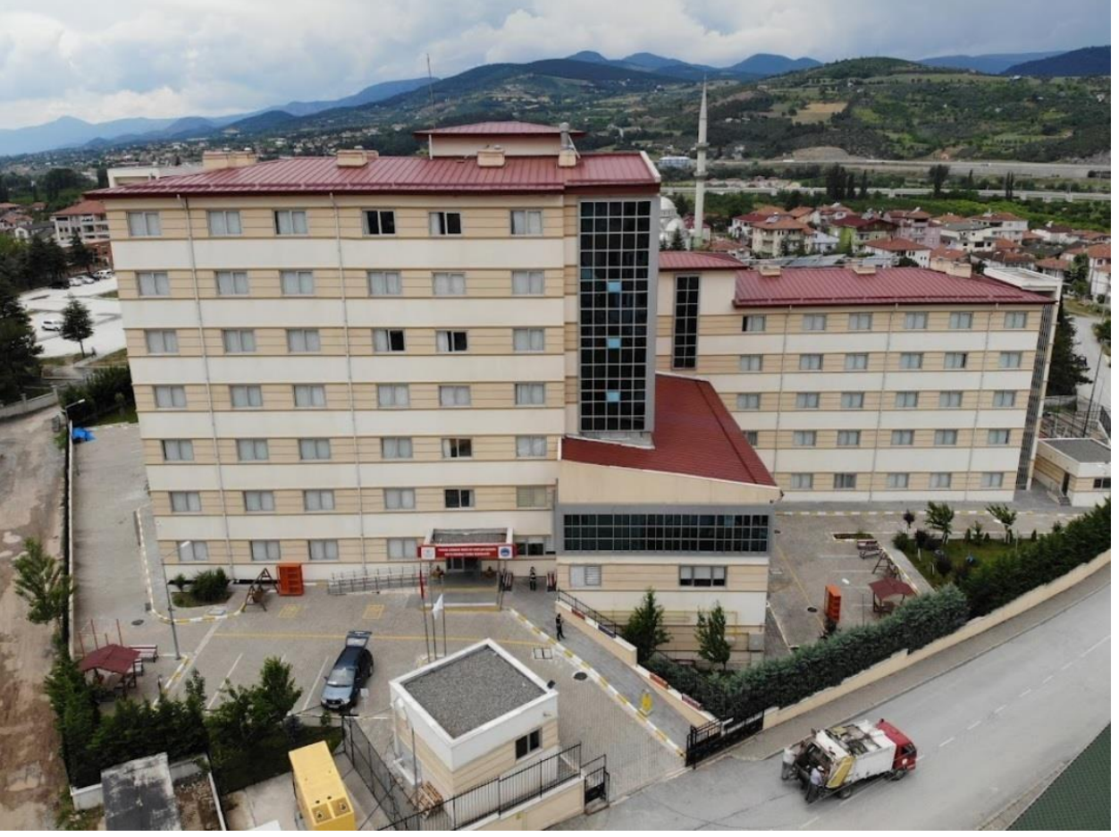
KYK Yurt Binası

Geyve Meslek Yüksekokulu Yerleşkesine beşyüz metre mesafede Kredi Yurtlar Kurumu'nun (KYK) 450 kişilik öğrenci yurdu bulunmaktadır.