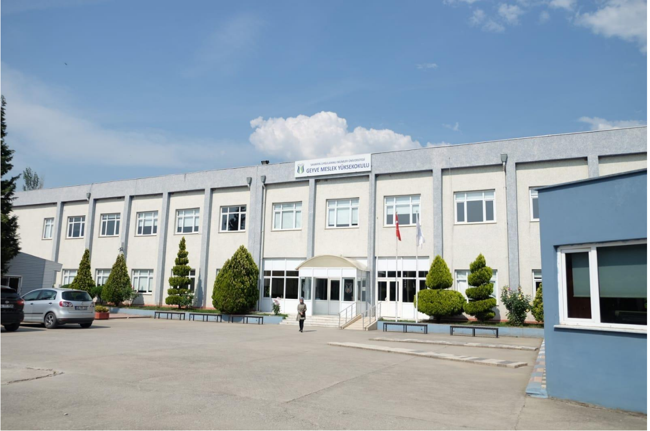
Geyve MYO Geyve Yerleşkesi

Amacımız, yüksek kalite standartlarında önlisans düzeyindeki temel bilgileri öğrenciye kazandırarak kamu ve özel sektör kuruluşlarında geleceğin nitelikli işgücünü karşılayacak, uygulama becerisi kazanmış iletişime açık bireyler yetiştirmektir.